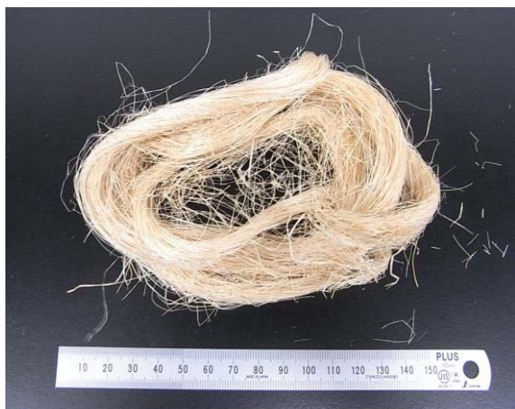
バナナ繊維 (主要成分はセルロース)

バナナの葉に着目し、グラフト側鎖先端に配位子を導入することで、新規金属イオン捕集材を得ることができました。