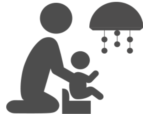
状況B: お母さんと赤ちゃんが一緒に遊ぶ