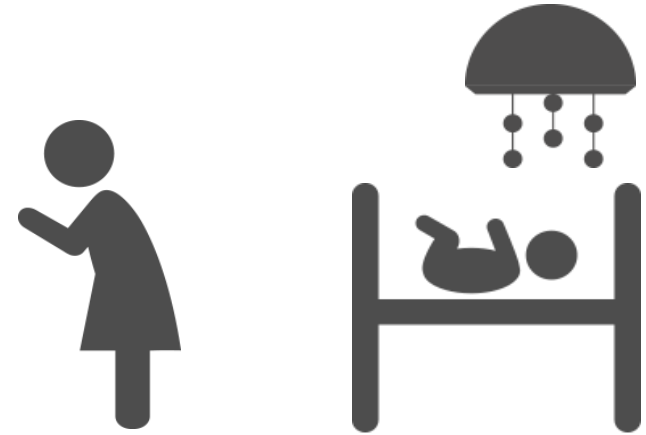
状況A: 赤ちゃんひとりの時にあやす