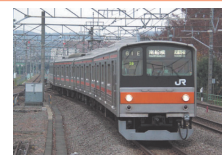
「駆動制御システム搭載車両」

13:45～14:15 ②長岡技術科学大学 「安全で快適な社会を構築するためのモーションコントロールと パワーエレクトロニクスの展開」 工学部 電気系 大石潔